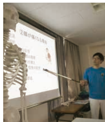
リハビリテーション技術科 地域包括ケアチーム

現在は全国で感染症が拡大しているため、中止とさせていただいております。今後、安心してご参加いただけるよう十分な感染対策を検討したうえで、活動の再開を考えております。