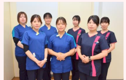
診療放射線技師・健診スタッフ